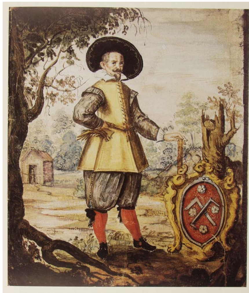
Georg Ridinger – Selbstportrait von 1612